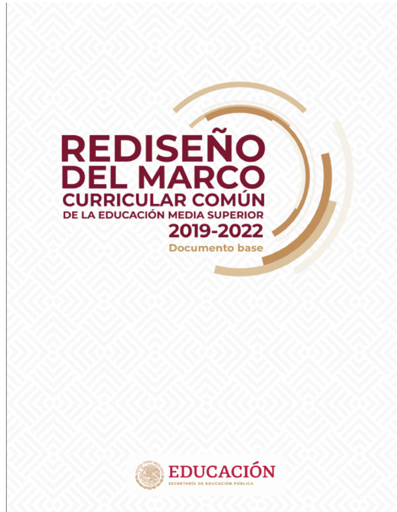
MARCO CURRÍCULAR COMÚN DE LA EDUCACIÓN MEDIA SUPERIOR (MCCEMS)